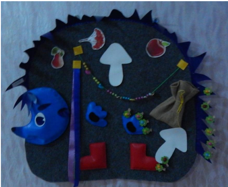
Тактильное панно «Ёжик»