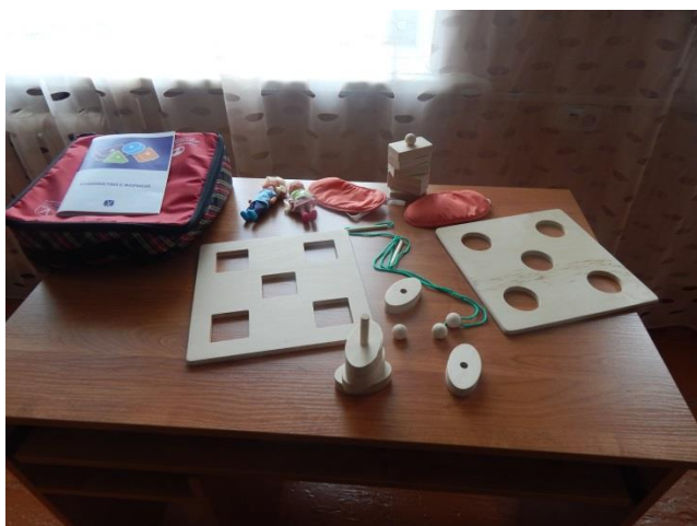
Набор для логопедических занятий