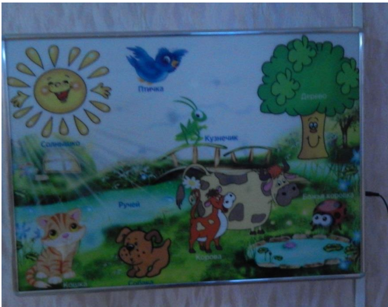
Интерактивная светозвуковая панель «Природный мир»