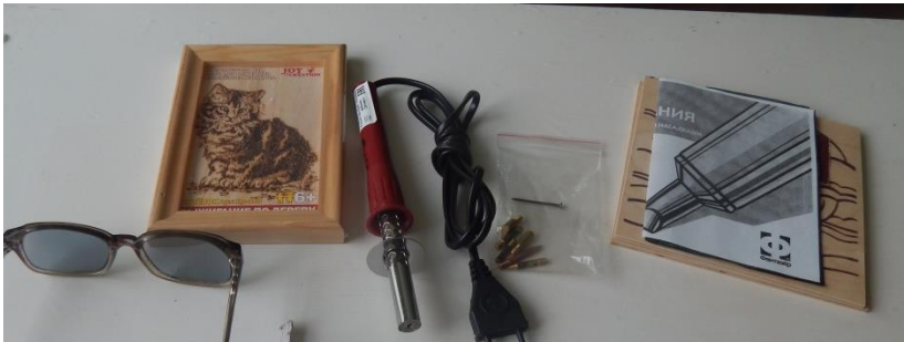
Прибор для выжигания