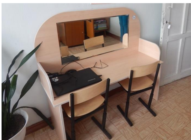
Стол логопедический с зеркалом