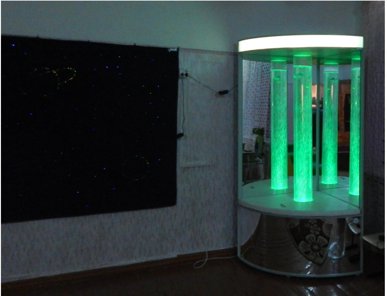
Звездное небо. Релаксационный уголок «Отражение» с пузырьковой колонной