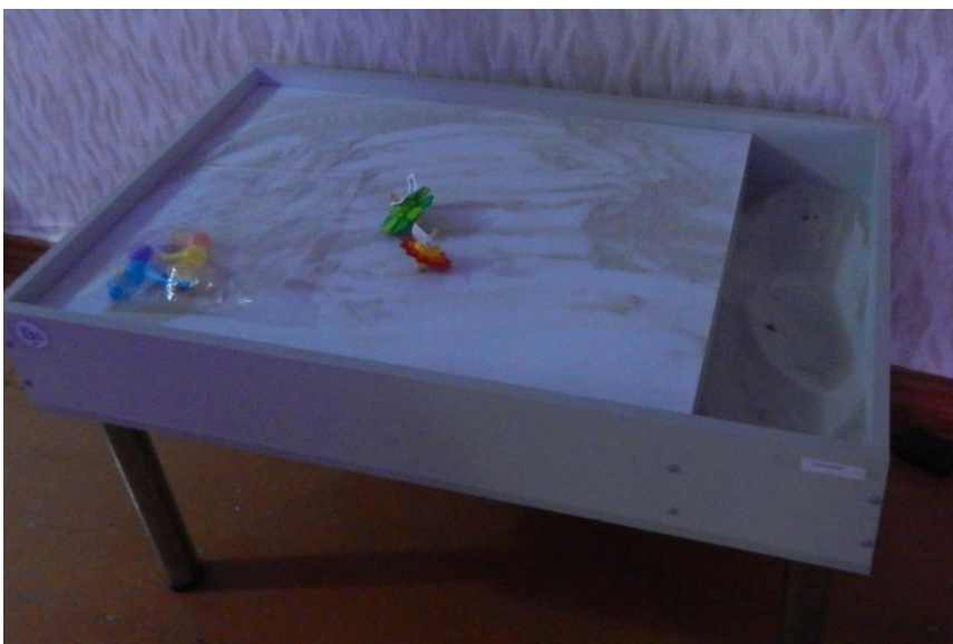
Стол световой для рисования песком