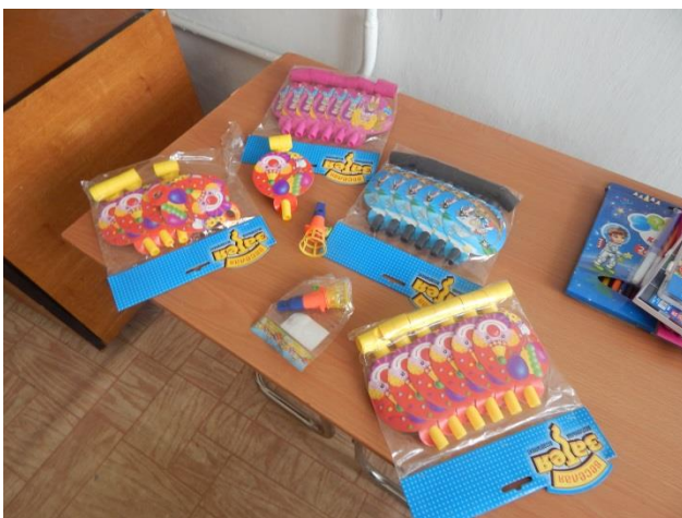
Набор для логопедических занятий