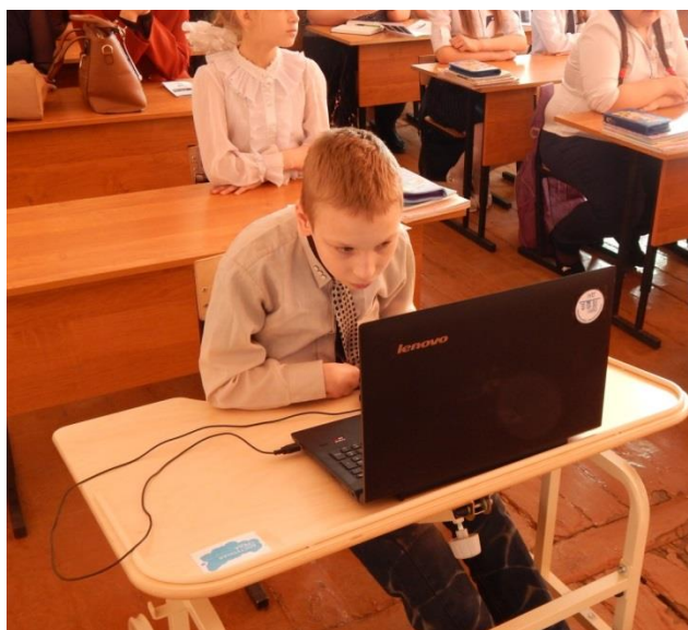
Парта для ребенка - инвалида